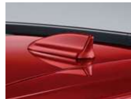
Antena de techo tipo "aleta de tiburón"