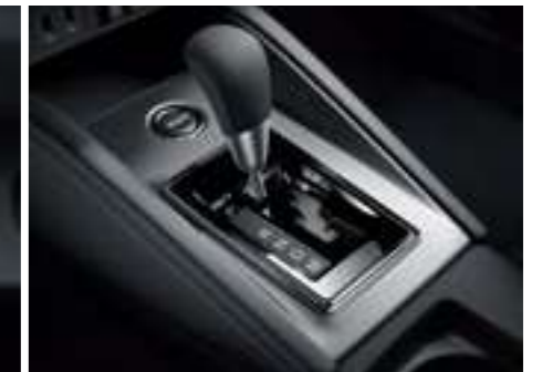
Transmisión automática CVT