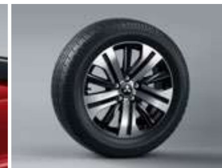
Llantas de aleación de 18"